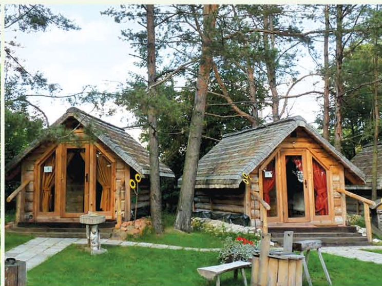
"Osiedle Zacisze" na ośrodku agroturystycznym "Binduga" w miejscowości Brok nad rzeką Bug